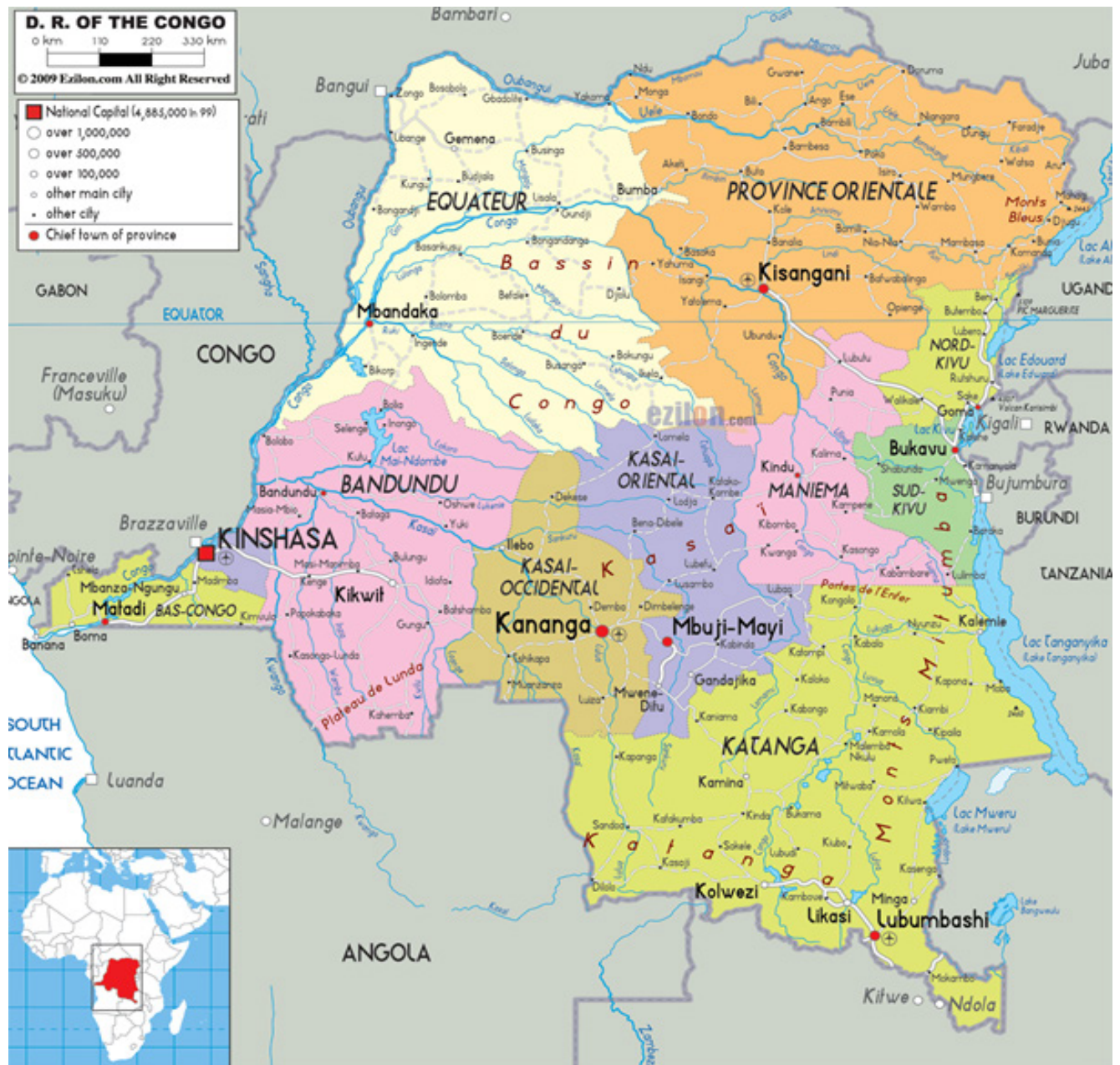
Figure 2: Carte de RDC