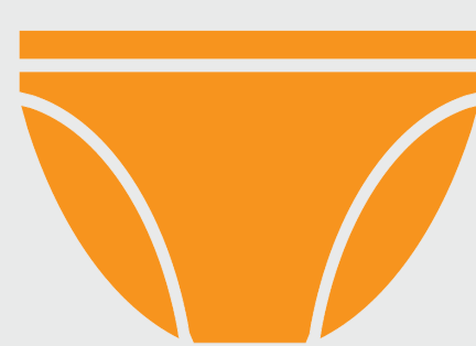
Женское нижнее белье