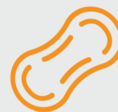
Комплект многоразовых менструальных прокладок